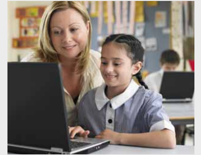
CAMBERWELL小学 5 分钟车程