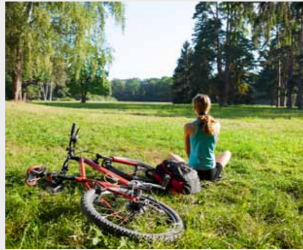
自行车径 8 分钟车程

如果你喜爱户外活动，那么你肯定不会失望，在别墅街道的两个尽头是两个美丽的公园。风景如画的BELMONT公园位于MANGARRA路北端，BOROONDARA公园则位于路的南端。公园设有休闲小径和自行车径，并与墨尔本著名的YARRA TRAIL相连，为您提供众多的休闲选择。别墅距离墨尔本市中心也仅仅是15分钟的火车路程，而且CANTERBURY十分靠近MONASH高速入口和EASTERN高速入口，为您周末出行带来更多选择。