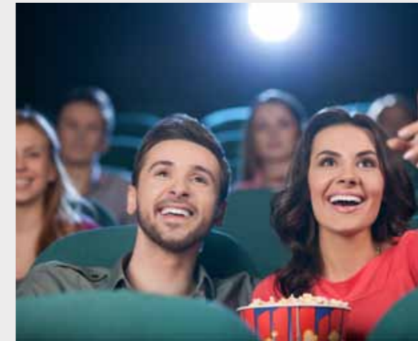
RIVOLI电影院 6 分钟车程