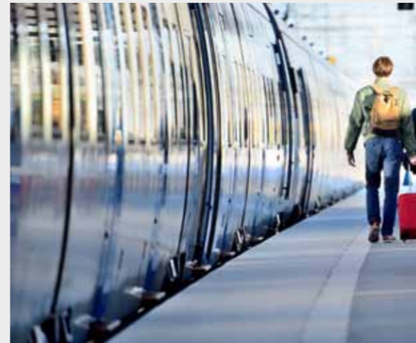
EAST CAMBERWELL火车站 步行 9 分钟