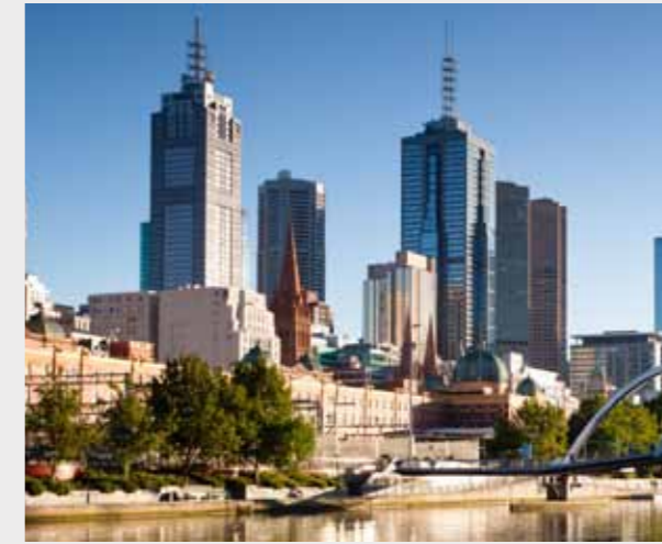
墨尔本市中心 15 分钟火车