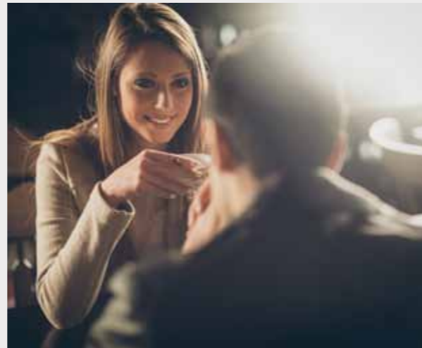
ELLE咖啡店步行 6 分钟