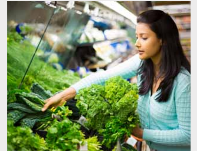
WOOLWORTHS超市 5 分钟车程